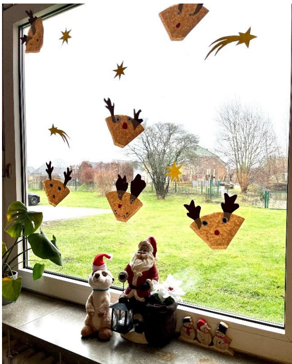
Die Fensterdekoration der Erdmännchen