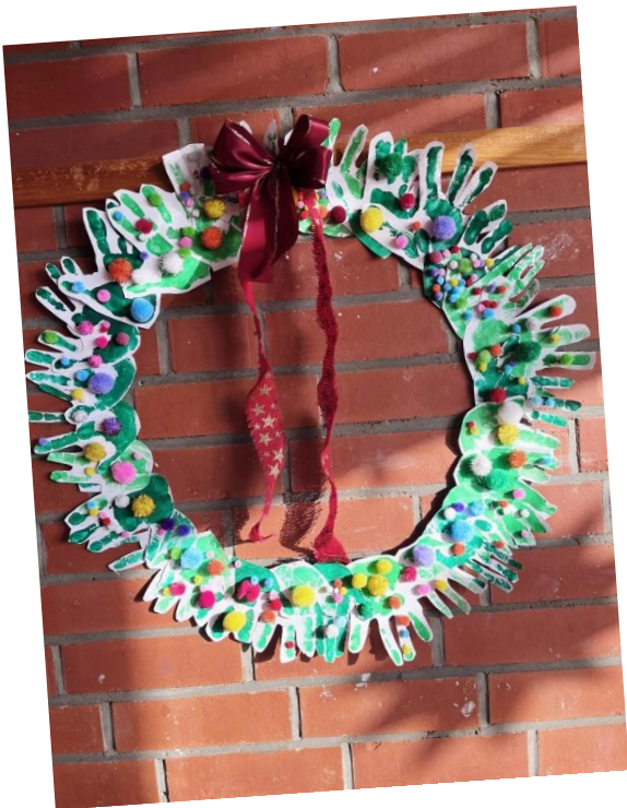
Der Weihnachtskranz der Igel