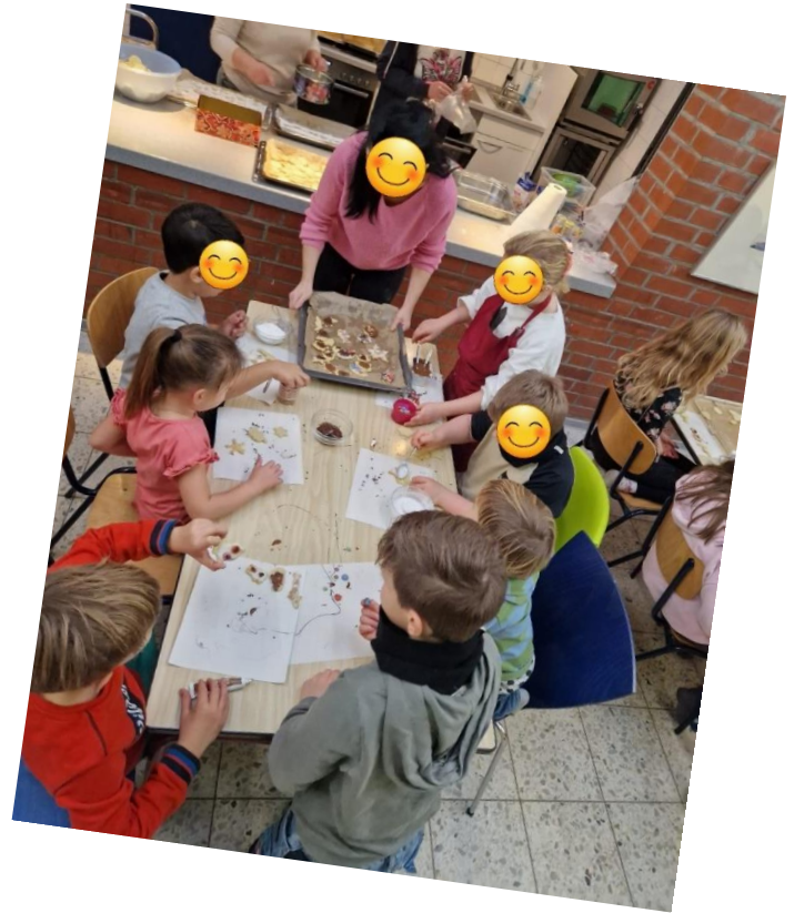
Die Füchse in der Weihnachtsbäckerei