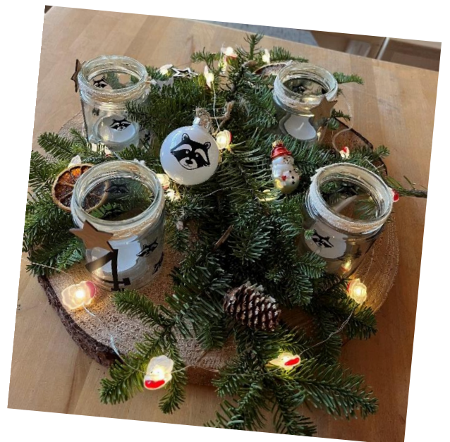
Der Adventskranz der Waschbären