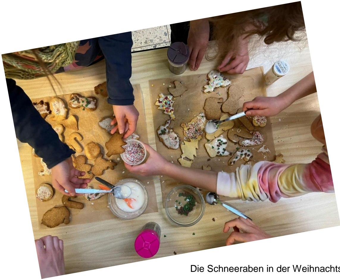
Die Schneeraben in der Weihnachtsbäckerei

Ein Wichtel besuchte die Eisbärenklasse.