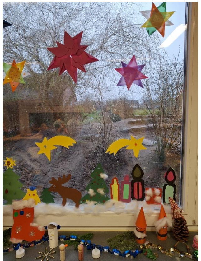
Die Fensterbankdekoration der Schildkröten