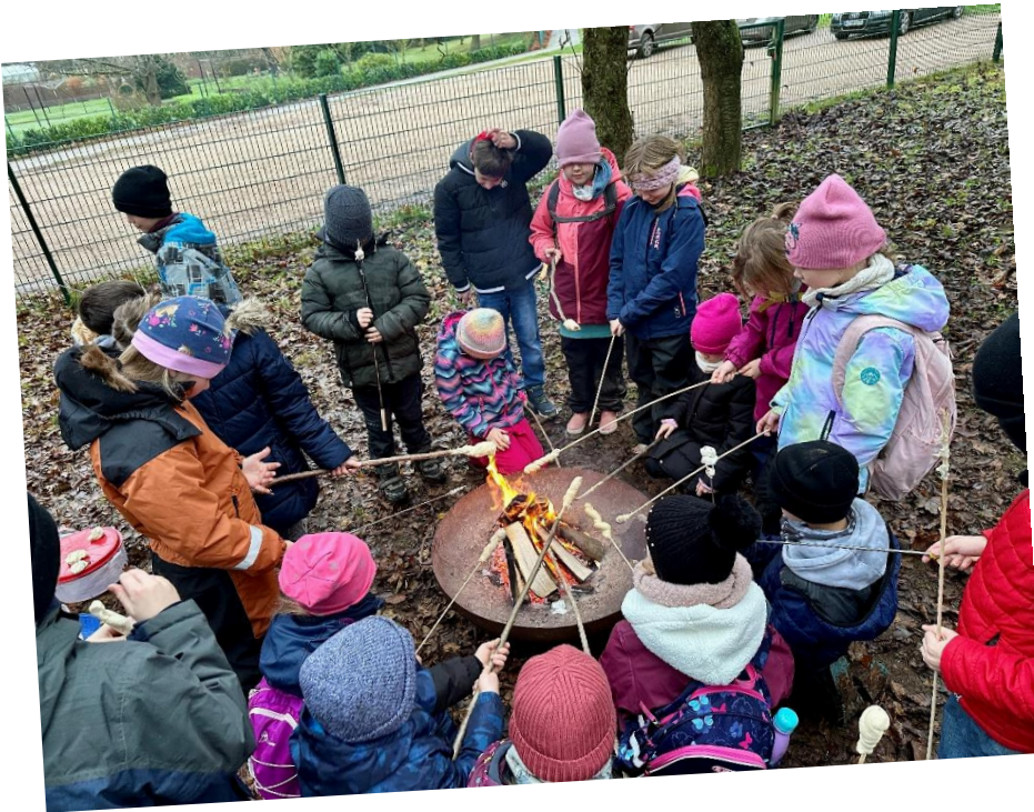
Die Koalas veranstalteten ein Stockbrotessen in der Draußenschule.