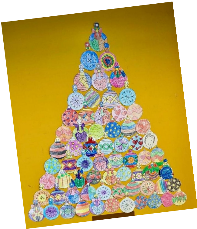
Ein gemeinsam gestalteter Tannenbaum der Bienen