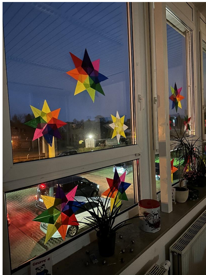
Sterne in der Pandaklasse